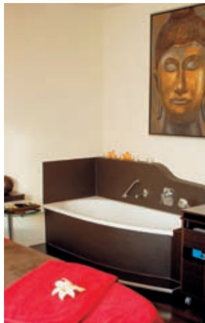
Eine Badewanne gehört zur Ausstattung des Wellness-Raums