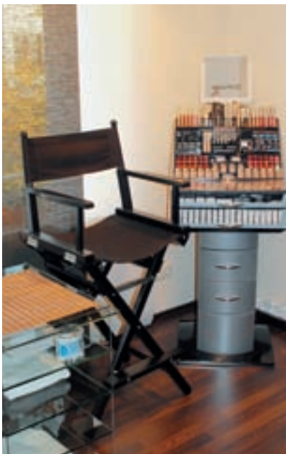
Am Schminkplatz gibt's nach der Behandlung ein typgerechtes Tages-Make-up